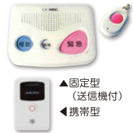
▲固定型 (送信機付) ◀携帯型