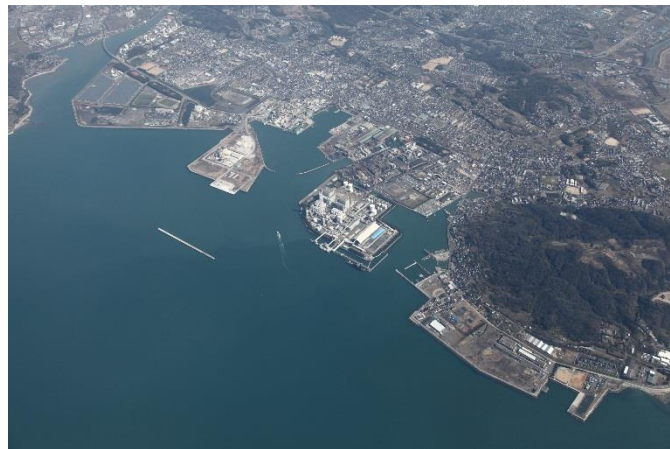
重要港湾小野田港