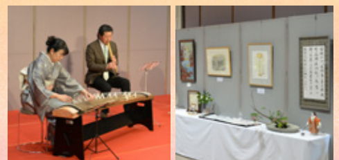
▲昨年の「アートのたまてばこ」の様子