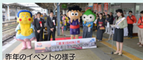
昨年のイベントの様子

※当日, 厚狭駅から「幕末ISHIN号」に乗車した人には, 列車内や終点東萩駅でのおもてなしがあります。