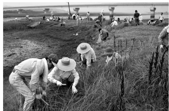
河川環境美化活動