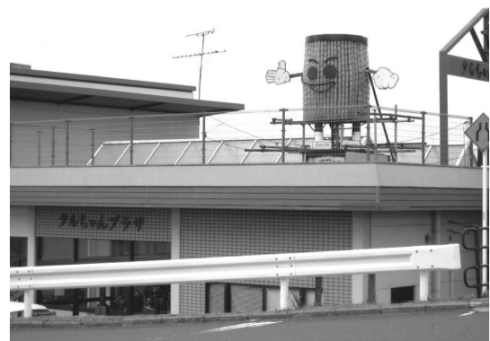
リサイクルプラザ