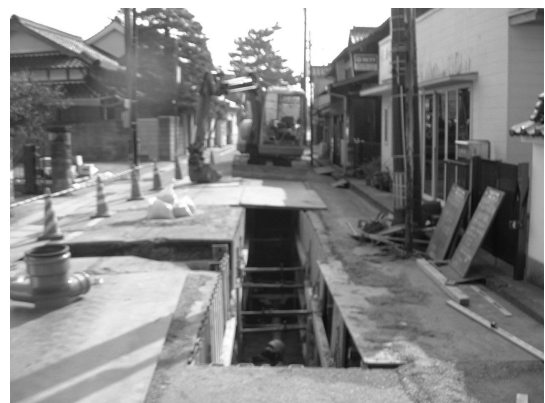
下水道（汚水）管の埋設