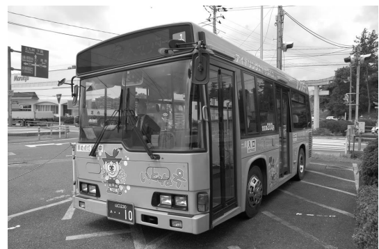
コミュニティバス「いとね号」