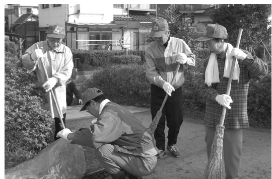
アダプトプログラムによる美化活動